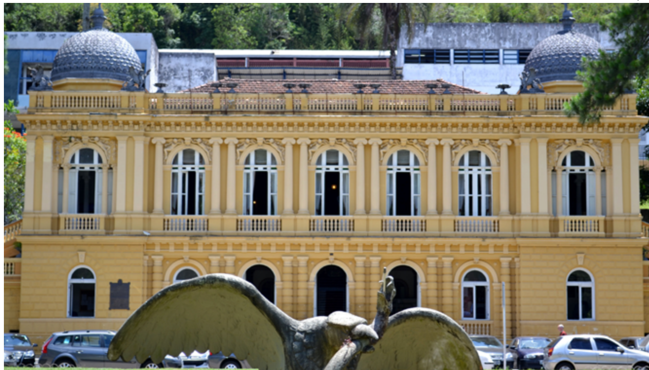
CÂMARA promove a 2ª edição da Gincana Solidária de Doação de Sangue, que mobiliza parlamentares e funcionários

Em Petrópolis, o Banco de Sangue Santa Teresa funciona diariamente, inclusive aos domingos e feriados, das 7h às 18h. O endereço é Rua DR. Paulo Hervê, 1130, no Bingen (ao lado do Banco Bradesco).