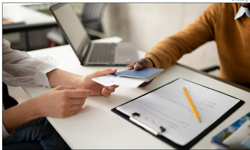
TRABALHADORES terceirizados têm mudanças na jornada de trabalho e em benefícios

Além do benefício, a norma ainda prevê a diminuição para 40 horas semanais, sem alteração de salário. A medida deve alcançar até 60 mil pessoas, de acordo com o MGI. A decisão dá continuidade à ação iniciada em 2024, que já beneficiou 12 categorias de trabalhadores em outras duas fases. Ficam de fora apenas os trabalhadores que cumprem regime de escala de revezamento 12 por 36 horas ou 24 por 72 horas.