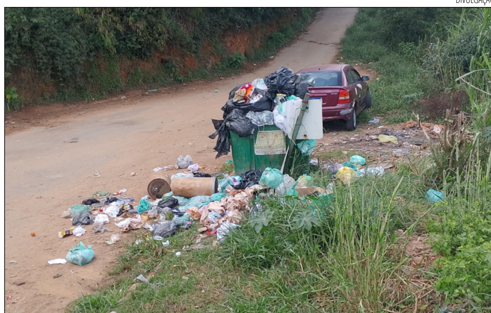
MORADORES reclamam que já ficaram até duas semanas sem coleta de lixo no local

Em janeiro desse ano, moradores do ponto final do Vincenzo Rivetti