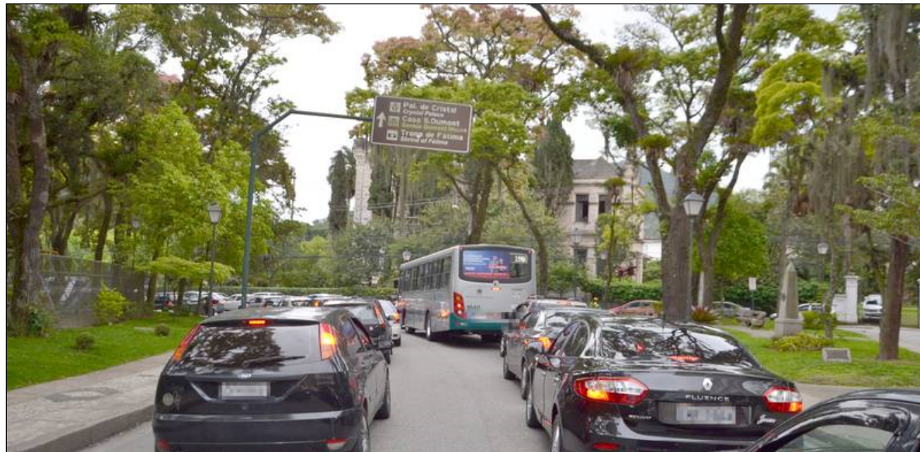
PROPRIETÁRIOS de veículos com placas terminadas em 6, 7, 8 e 9 têm até quinta-feira (9/4) para pagar a terceira parcela

Depois, basta informar o Renavam vinculado ao CPF da conta usada na autenticação, selecionar os débitos a serem quitados e autorizar o redirecionamento para o portal da empresa credenciada que realizará a transação. Por fim, é só preencher