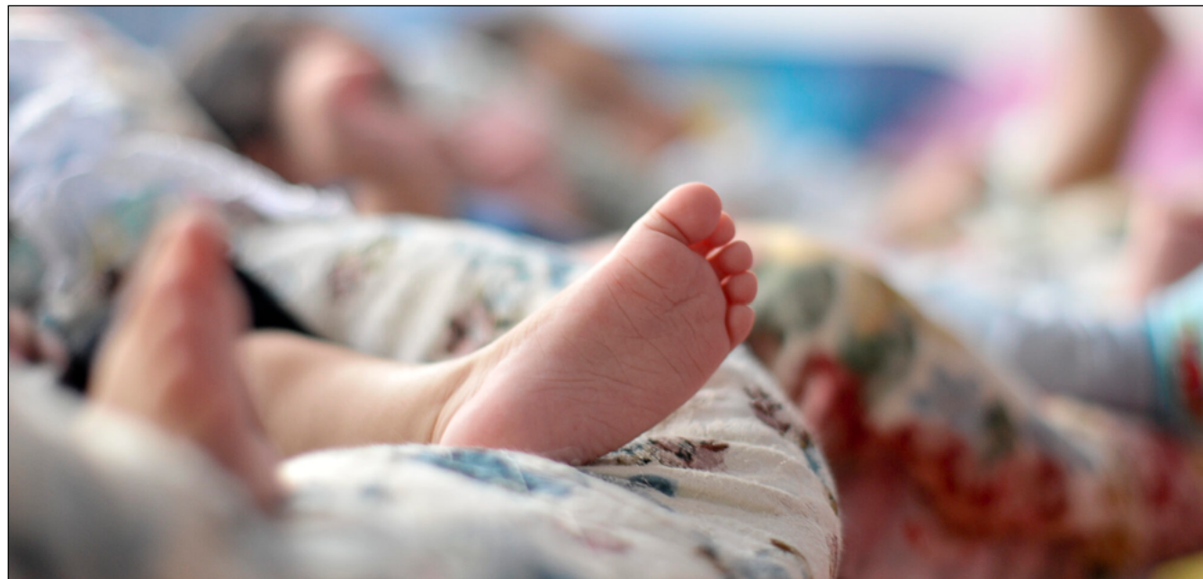
PETRÓPOLIS registrou 240 mortes infantis consideradas evitáveis com assistência durante gestação entre 2020 e 2024

No caso brasileiro, o relatório sobre mortalidade infantil da ONU aponta progressos notáveis nas últimas décadas. Segundo o Fundo das Nações Unidas para a Infância (Unicef), um conjunto de políticas adotadas nacionalmente têm diminuído as mortes preveníveis de crianças, em con-