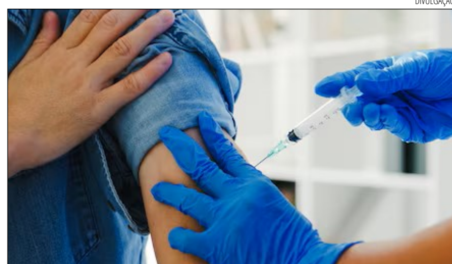
CAMPANHAS de vacinação e serviços de diagnóstico devem ser divulgadas

ções (PNI) relacionadas à vacinação, 76,04% das mulheres do município estão vacinadas em 2026 contras a HPV, cerca de 10% a mais em comparação ao número de homens do município, sendo até o momento de 65,75% de homens vacinados. Os dados do Sistema Único de Saúde (SUS) apontou que, no ano passado, 162 internações relacionadas a câncer de mama no município, além de 80 homens internados por câncer de próstata e 10 relacionadas a câncer do colo do útero.