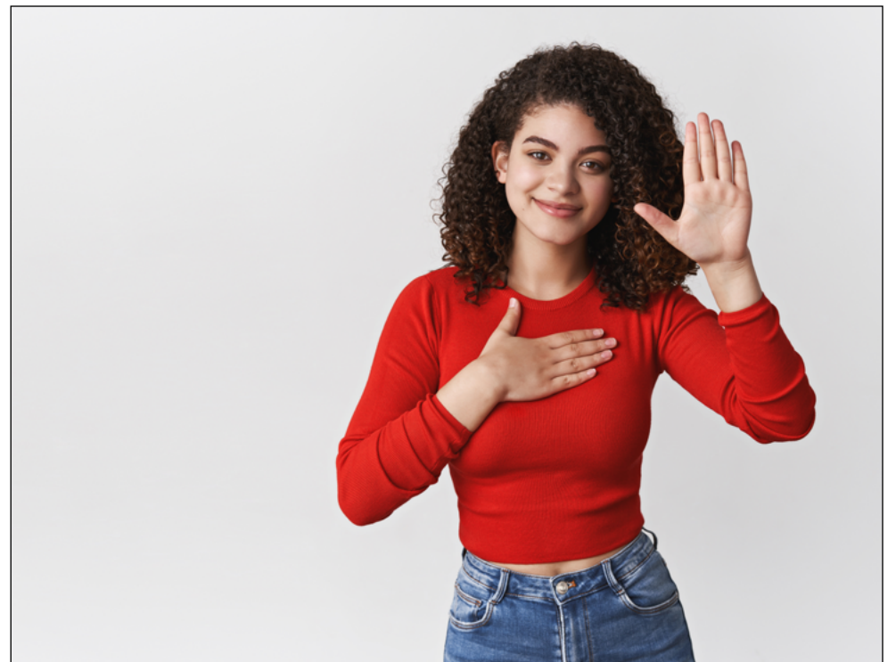
INTÉRPRETE de libras para procedimentos médicos em pessoas com deficiência auditiva

A decisão foi publicada no Diário Oficial desta segunda-feira (06/04), após assinatura de Ricardo Couto. De acordo com o texto, a eventual impossibilidade de disponibilização do intérprete, por qualquer motivo, não poderá impedir a realização do procedimento, nem alterar a ordem de atendimento do paciente. Nesses casos, a ausência do profissional deverá ser devidamente justificada, sob pena de responsabilização do gestor da unidade.