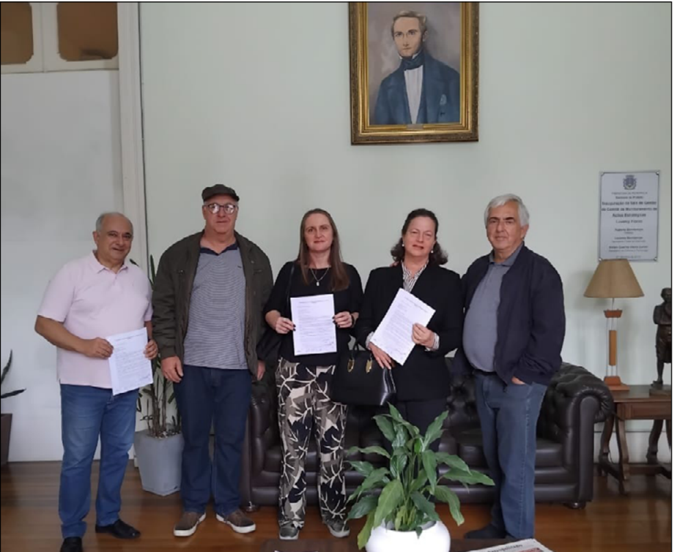
ENTIDADES se unem em manifesto sobre projeto da Prefeitura para novos bairros

te nove quarteirões e um setor que juntas, completam 33 regiões, que compõem o primeiro conjunto de localidades que integram o planejamento urbano de Petrópolis no período Imperial.