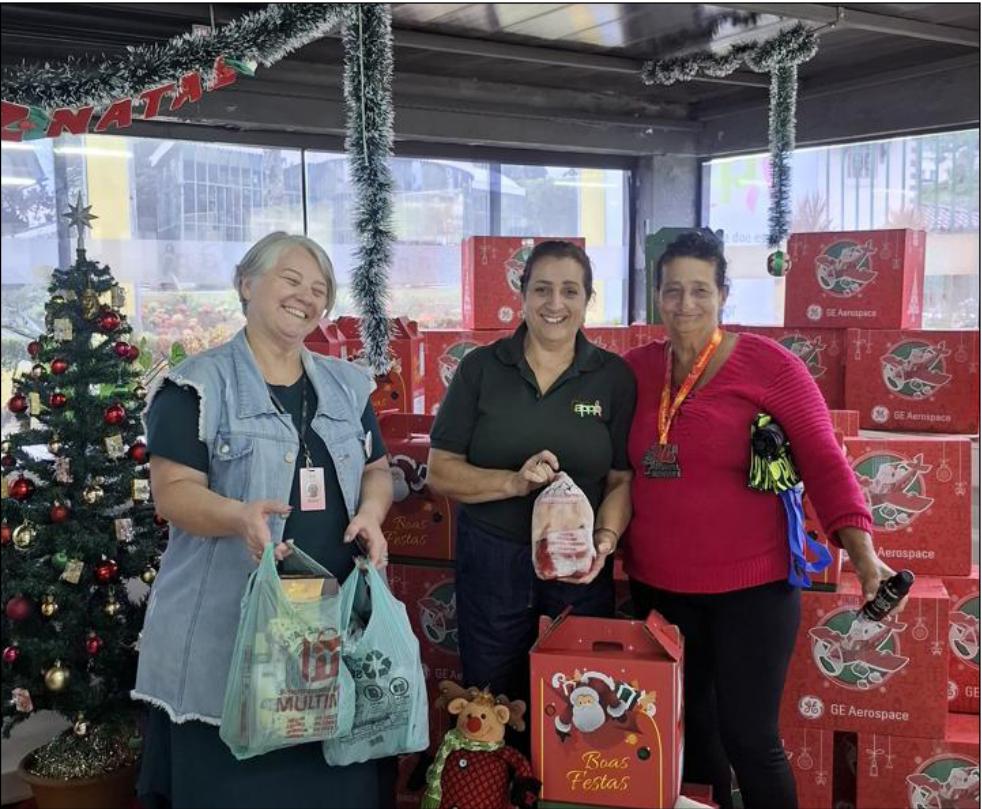
O CLIMA da entrega das cestas foi de afeto em um ambiente de alegria, abraços e emoção

A Associação Petropolitana dos Pacientes Oncológicos (APPO) realizou, na manhã dessa sexta-feira, 19 de dezembro, às 10h, a entrega das tradicionais Cestas de Natal para as 60 famílias acompanhadas pela instituição, em uma ação marcada pela emoção, gratidão e forte sentimento de acolhimento. A distribuição, que simboliza um dos momentos mais esperados do ano pelos pacientes, reforça o compromisso da APPO em garantir dignidade e qualidade de vida às pessoas em tratamento oncológico e familiares, especialmente em um período tão significativo quanto o Natal.