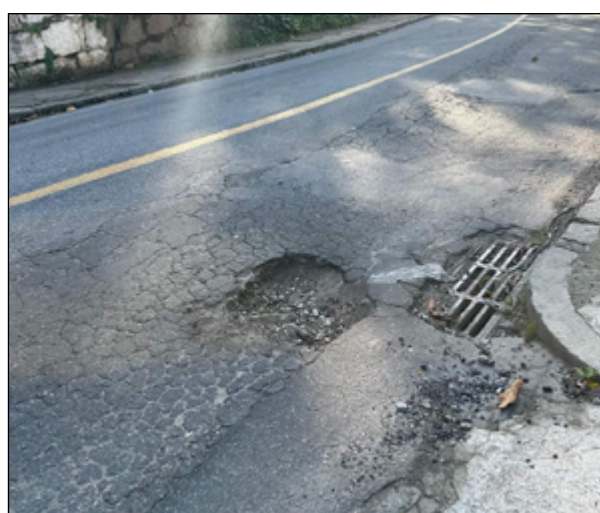
BURACOS fundos e diversos trechos da rua preocupam

A Secretaria de Obras informou que enviará em breve uma equipe ao local para verificar a situação relatada e realizar os reparos necessários na via.