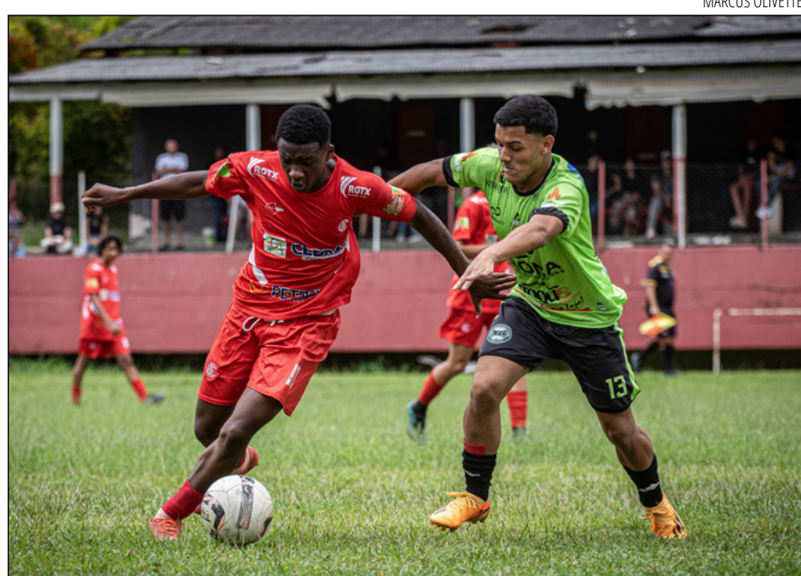
OS FINALISTAS do campeonato municipal serão conhecidos na próxima semana

Mais informações podem ser vistas no site ligapetropolis.com.br .