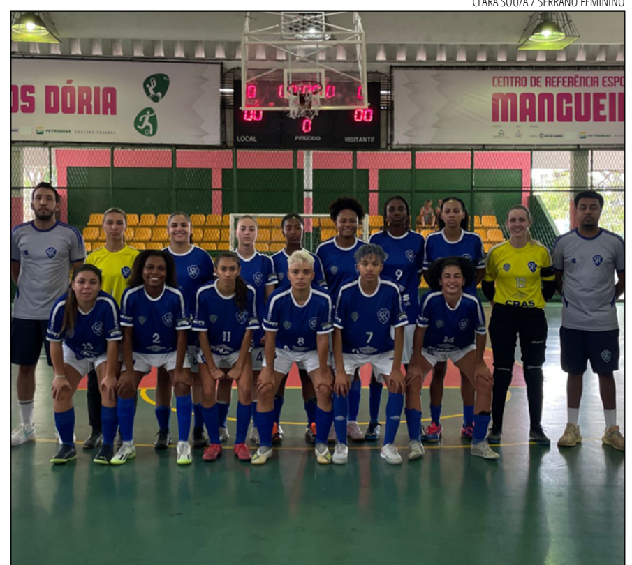
MESMO com a derrota, as meninas do Serrano tiveram bom desempenho no jogo

Apesar dessa vez não conquistar a vitória, as LeoaS da Serrano voltaram para Petrópolis contentes com o resultado de estreia. "Tenho orgulho do que estamos conquistando e construindo. É importante para a cidade ter esse incentivo ao futebol feminino, e para o Clube Centenário poder ser referência com as meninas é magnífico",