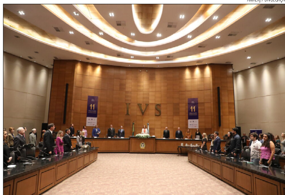
O PRÊMIO foi criado em 2012 e tem como objetivo destacar ações pelos Direitos Humanos

O primeiro lugar de cada categoria ganhará R$ 17 mil; o segundo, R$ 12 mil; o terceiro, R$ 6 mil. Os três primeiros colocados receberão troféus. Os demais finalistas serão homenageados com menções honrosas. Na categoria Trabalhos dos Magistrados, não haverá premiação