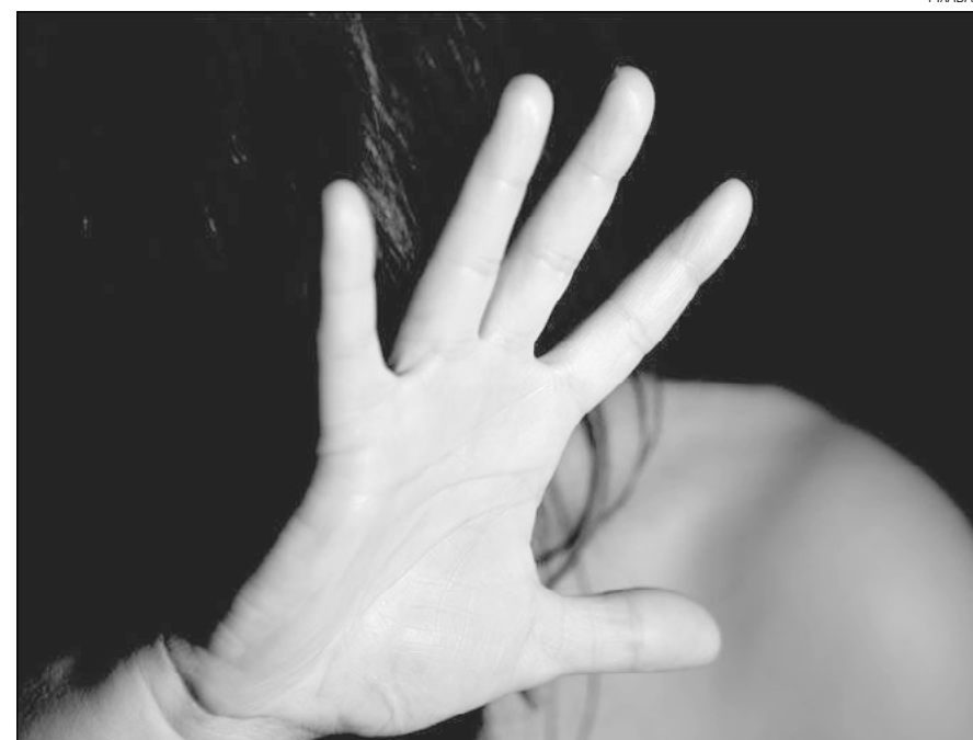
ENTRE os tipos de violência, a psicológica predomina, segundo o documento