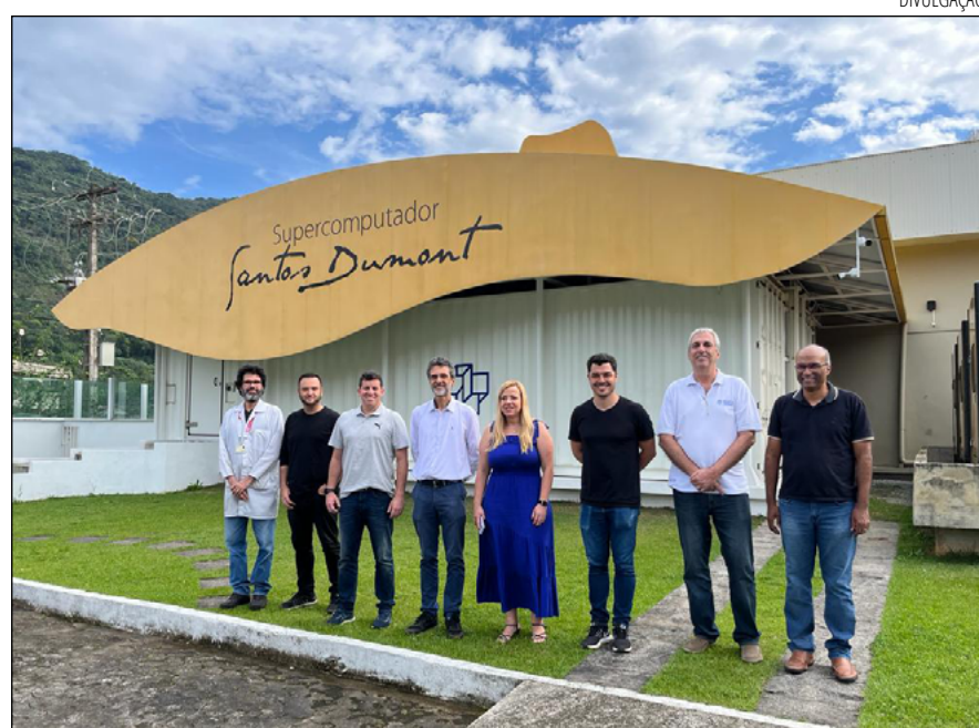
A REUNIÃO no LNCC foi um desdobramento da audiência pública sobre prevenção

A reunião realizada no LNCC é mais um desdobramento da audiência pública realizada pelo parlamentar, em conjunto com o senador Carlos Portinho e o deputado federal licenciado Hugo Leal (atual secretário estadual de Energia e Economia do Mar) na Câmara Municipal, no fim de setembro, com a participação