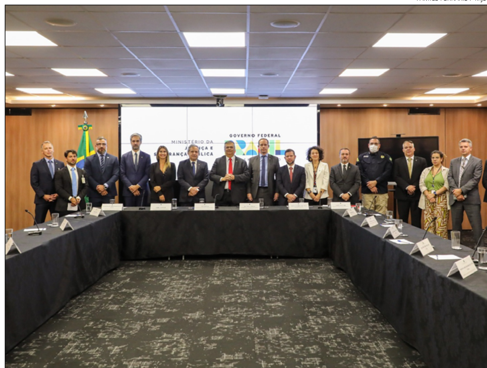
A CRIAÇÃO do CIIFRA será formalizada hoje e irá reunir membros estaduais e federais

O ministro Flávio Dino destacou que os trabalhos buscam “desidratar financeiramente o crime organizado”.