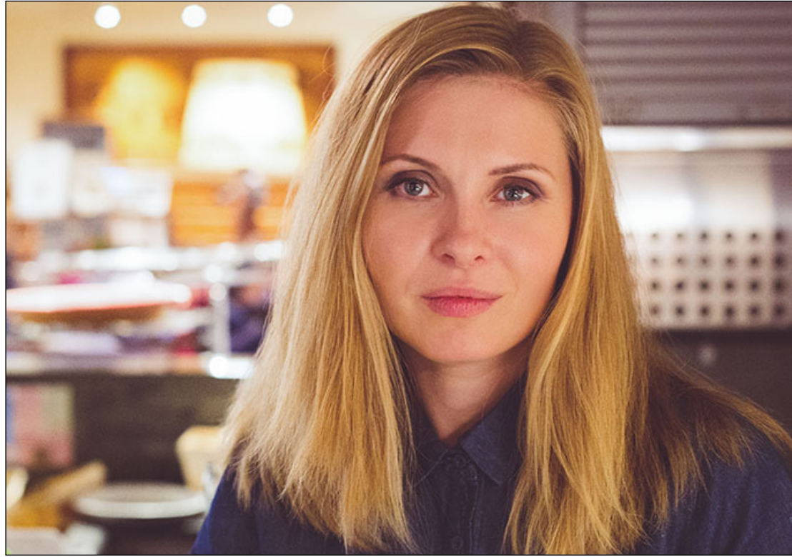
Encontro será on-line, nesta quarta-feira, a partir das 19h, pelo Google Meet

A participação é gratuita, e os interessados em se juntar a essa discussão envolvente podem solicitar o