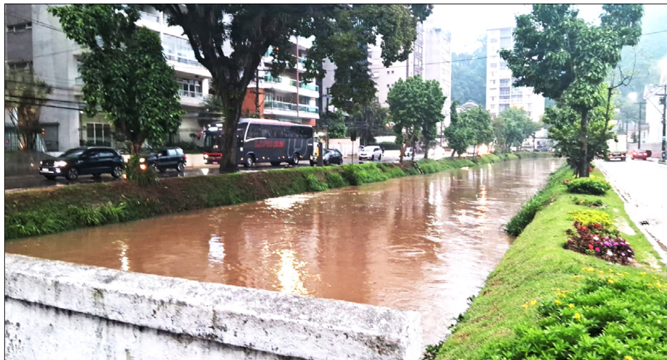
NO CENTRO, por pouco o rio não transbordou, e em Corrêas, foram registrados alagamentos na União Indústria

Na BR-040, houve uma queda de barreira, de árvore e de fragmento de rocha no kms 98, 99 e 93 da pista de subida, o que chegou a provocar lentidão de