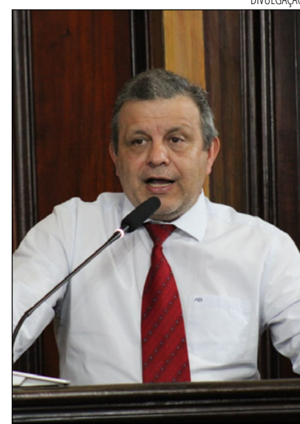
O VEREADOR se defendeu na sessão

A denúncia relata que o vereador, eleito para o mandato de 2021 a 2024, pôs em prática em seu gabinete um esquema de enriquecimento ilícito, condicionando a manutenção de ser-