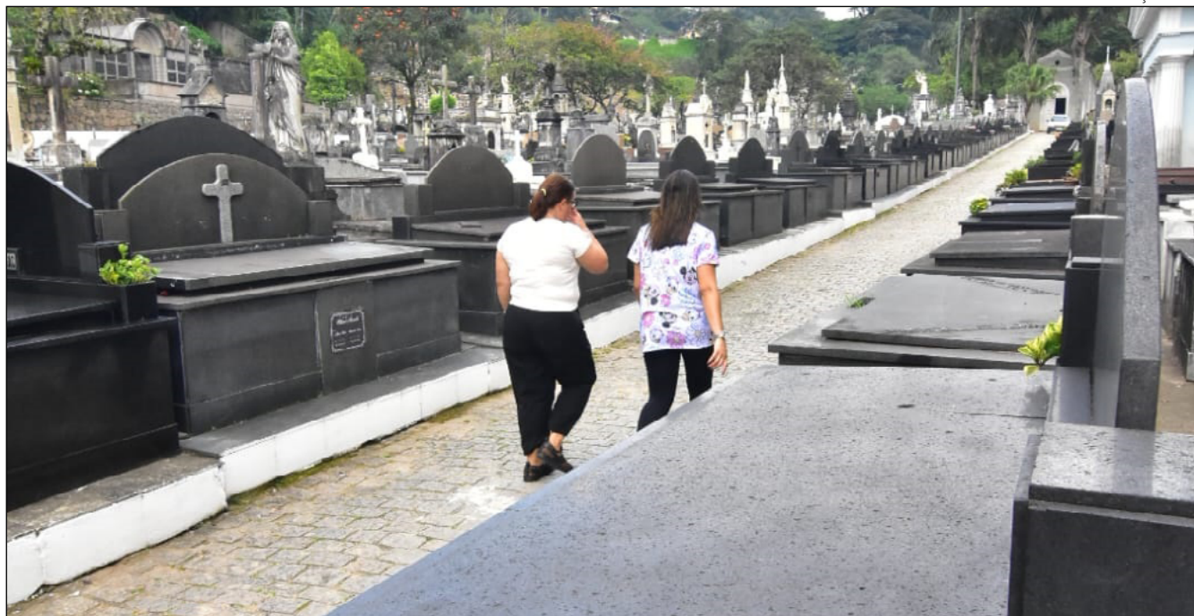
NO CEMITÉRIO da Rua Fabrício de Mattos, no Centro, haverá missa às 10h e em Itaipava, a cada duas horas, ao longo do dia

Em função do feriado, foi decretado pelo Governo do Estado