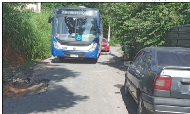
MORADORES reclamam das péssimas condições da via

Quanto aos buracos, a Secretaria de Obras informou que enviará uma equipe ao local para verificar as informações recebidas e re-