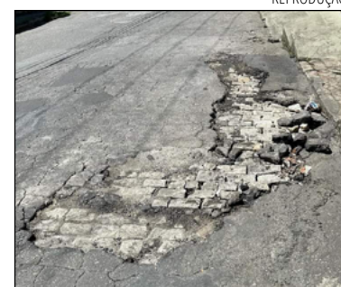
BURACO próximo ao nº 163 da via

informou que enviará uma equipe ao local para verificar as informações recebidas e realizar os reparos na via, conforme cronograma de ações. Vale ressaltar que as fortes chuvas que a cidade enfrenta nos últimos dias também causam danos à pavimentação.