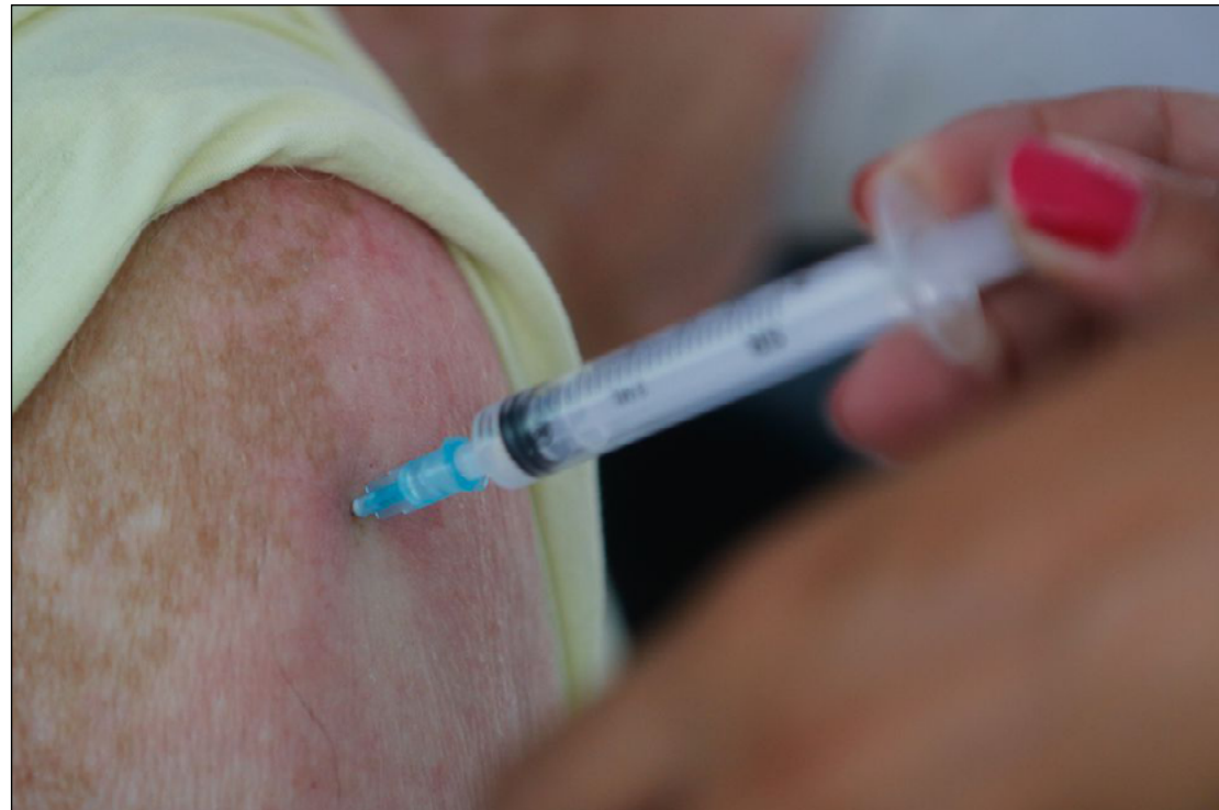
COM A INCLUSÃO no programa nacional, a vacinação será oferecida a partir dos grupos prioritários

"É uma mudança importante, alinhada com a Organização Mundial da Saúde [OMS], em que a vacina contra a covid-19 passa a incorporar o nosso Programa Nacional de Imunizações. Durante a pandemia, foi criado um programa paralelo, para operacionalização da vacina contra a covid-19, fora do nosso programa nacional. O que fizemos este ano foi trazer a vacina contra a covid-19 para dentro do Programa Nacional de Imunizações. A vacina