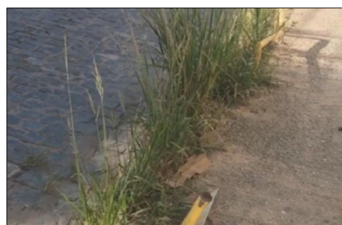
MATO alto na calçada dificulta o trânsito de pedestres

Procurada, a Prefeitura não respondeu até o fechamento desta edição.