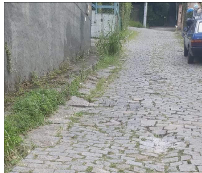
PARALELEPÍDOS soltos ou faltando geram buracos pela rua

Procurada, a Prefeitura não respondeu até o fechamento desta edição.