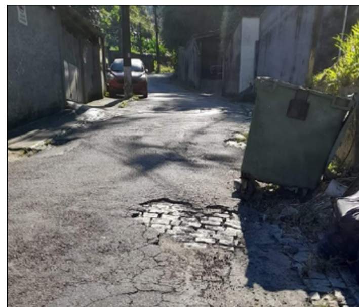
EQUIPAMENTO está quebrado e não comporta o lixo despejado

A Comdep, questionada, informou que vai fazer uma vistoria no local e avaliar a necessidade de reparo ou substituição do equipamento.