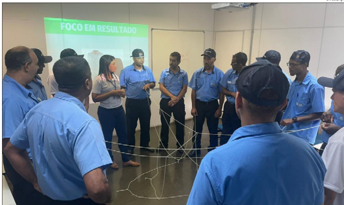
O PLANEJAMENTO de capacitação aos motoristas da Turp Transporte contou com uma série de palestras e dinâmicas

“Tornamos o treinamento dinâmico e incisivo, estimulando a participação dos motoristas nas atividades propostas e abrindo espaço para que fossem colo-