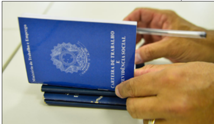
AS VAGAS disponíveis e as inscrições estão no site da prefeitura