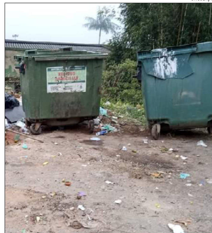
MORADORES reclamam da sujeira que fica em torno das lixeiras

Procurada, a Prefeitura não respondeu até o fechamento desta edição.