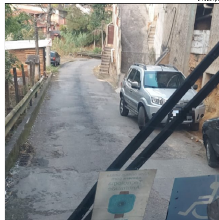
EM DIVERSOS bairros o transporte público é prejudicado

A Companhia Petropolitana de Trânsito e Transportes (CPTrans) informou que rondas são realizadas diariamente em toda a cidade multando e, em casos extremos, rebocando os veículos que