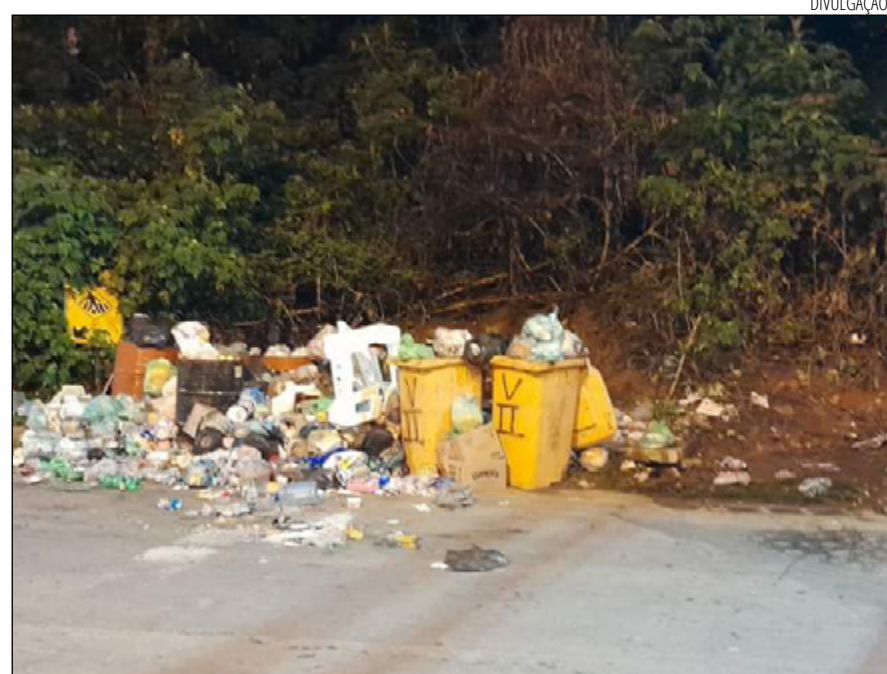
LIXEIRAS e tonéis não estão dando conta da grande quantidade de descartes