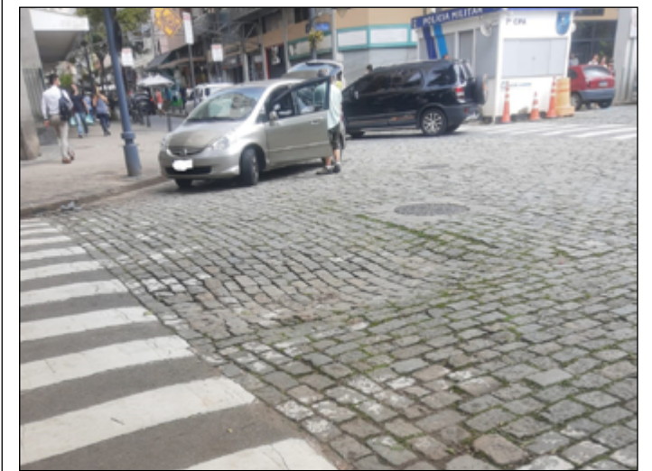
MOTORISTAS reclamam do afundamento de um trecho da rua