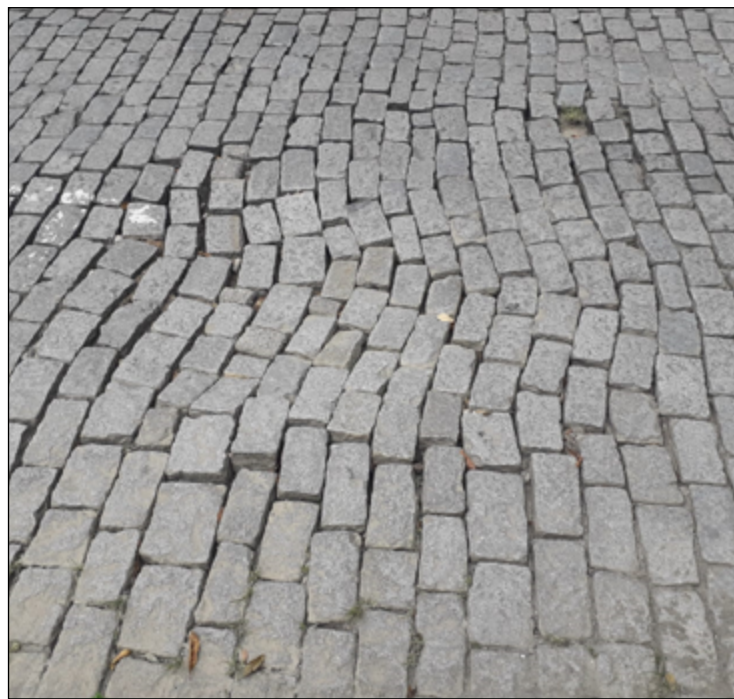
RUAS Barão de Teffé e Epitácio Pessoa apresentam o problema