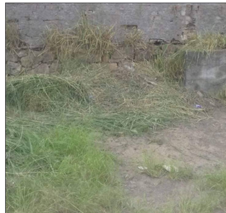
FALTA de capina e roçada faz mato tomar conta de calçadas

A Prefeitura informou que o local está dentro do cronograma de mutirões de serviços da Comdep, e estará recebendo as intervenções necessárias em breve.