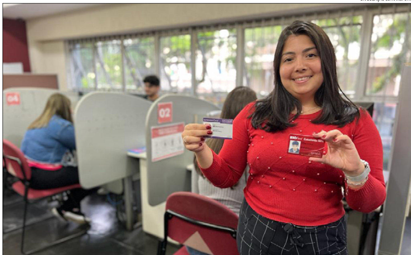
ESTUDANTES devem ficar atentos para não perderem a gratuidade e desconto no transporte público em Petrópolis

Os atendimentos já estão acontecendo normalmente, de segunda a sexta-feira, das 9h15 às 17h, na Rua do Imperador, nº 100 – Centro, próximo ao Terminal. Para todos os tipos de atendimento, é necessário que os estudantes baixem e preencham