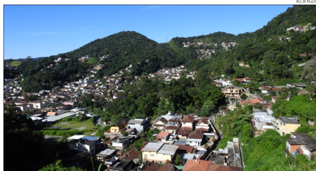
NOVO código atualiza, moderniza e desburocratiza a legislação municipal e se adequa às normas existentes