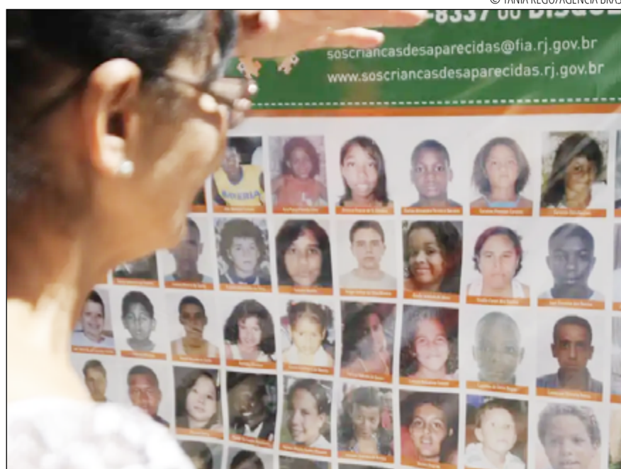
A SITUAÇÃO afeta diretamente a vida de muitas famílias gerando angústia