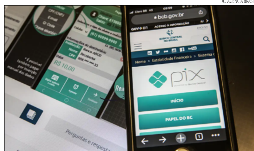
CONSUMIDORES devem ter ainda mais atenção com as compras de fim de