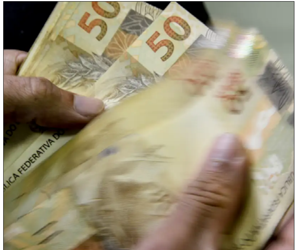
O TETO dos juros para o cartão de crédito consignado caiu de 2,73% para 2,67% ao mês

O limite dos juros do crédito consignado do INSS foi objeto de discussões no início do ano. Em março, o CNPS reduziu o teto para 1,7% ao ano. A decisão opôs os ministérios