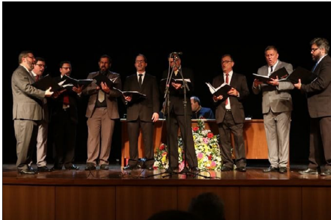
Apresentação será no próximo 16 de dezembro, às 20h30; ingressos já estão à venda

Um repertório diversificado será apresentado durante o evento especial de Natal, trazendo uma atmosfera única e emocionante. Entre as músicas que compõem o programa estão "Puer Natus Est", um emocionante canto gregoriano, seguido por "Transemus Usque Bethlehem" de Schnabel. O clássico "O Little Town of Bethlehem" de Lewis H. Redner e "The First Noel", um canto tradicional natalino, também estarão presentes.