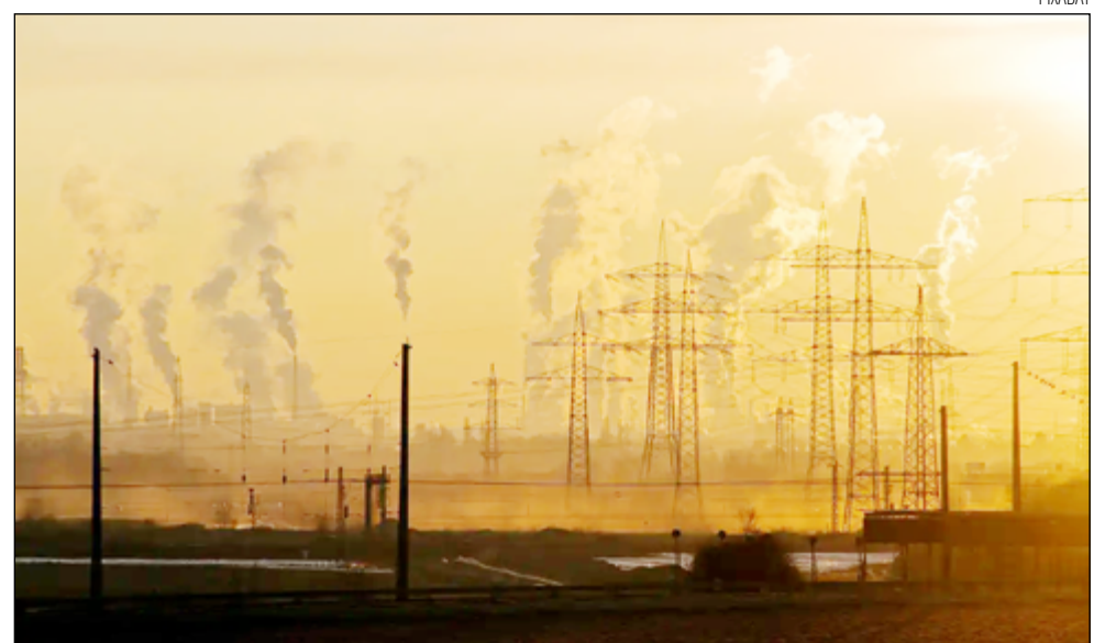
TEXTO final tem uma série de ações que os países podem adotar para reduzir as emissões

O presidente Luiz Inácio Lula da Silva vem cobrando que os países ricos cumpram os compromissos assumidos no âmbito internacional,