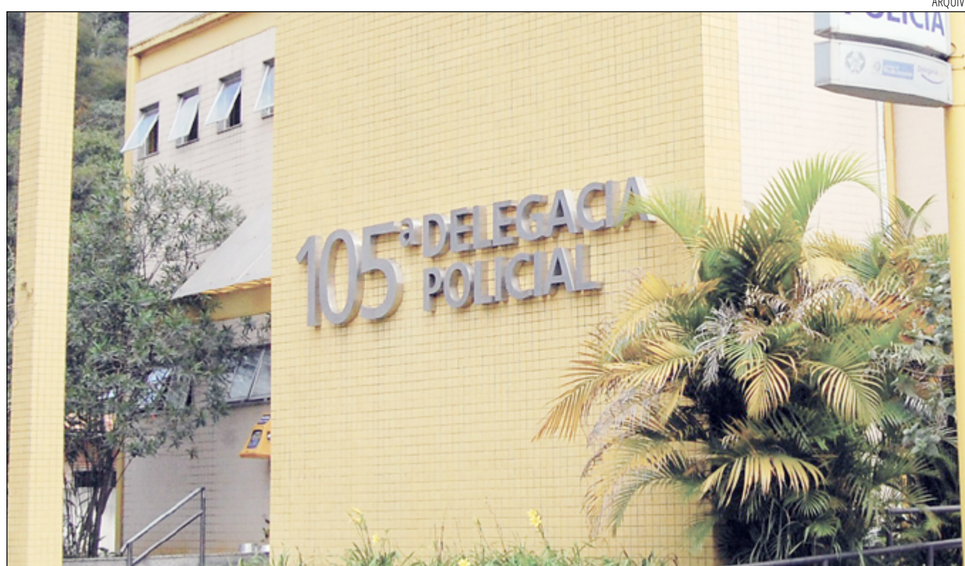
CONSTATANDO de fato o desaparecimento, deverá ser registrado o Boletim de Ocorrência de forma imediata na Delegacia

Nos últimos cinco anos, Petrópolis tem registrado o aumento alarmante no número de pessoas desaparecidas. A situação afeta diretamente a vida de muitas famílias, gerando angústia e a dúvida se o parente retornará para casa. De acordo com dados do Instituto de Segurança Pública do Estado do Rio de Janeiro (ISP-RJ) o número de casos saltou de 72 em 2018 para 238 em 2022, por conta da tragédia das chuvas, somando 410 desaparecidos até então. No ano de 2018, dos 72 desaparecimentos, 63,9% das vítimas são homens e