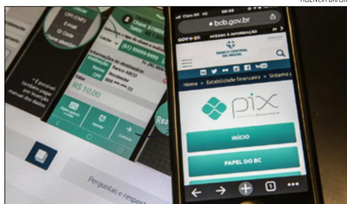
EM 12 meses 7,2 milhões de pessoas foram vítimas de golpes