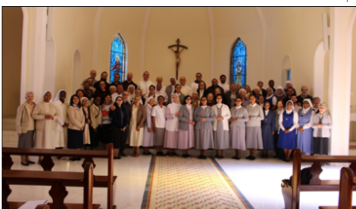
O CONGRESSO foi realizado no Instituto Teológico Franciscano