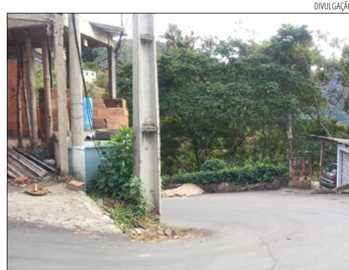
MOTORISTAS temem acidentes por falta de visibilidade na curva

Procurada, a Prefeitura não respondeu até o fechamento desta edição.