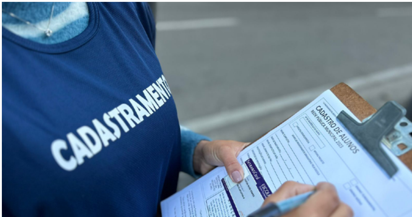
SETRANSPETRO implanta cadastro itinerante do cartão nas escolas em parceria com a Secretaria Municipal de Educação

“A evasão escolar é percebida desde a pandemia. Em seguida, tivemos a catástrofe no