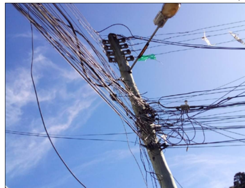
MORADORES reclamam que poste está com lâmpada queimada

A Secretaria de Segurança, Serviços e Ordem Pública (SSOP) informou que vai encaminhar uma equipe ao local.