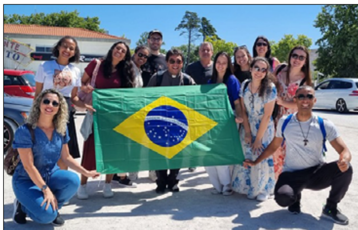
OS JOVENS peregrinos da Diocese de Petrópolis estão em Lisboa

A parceria de cooperação técnica com o CRCRJ oferece qualificação a estudantes