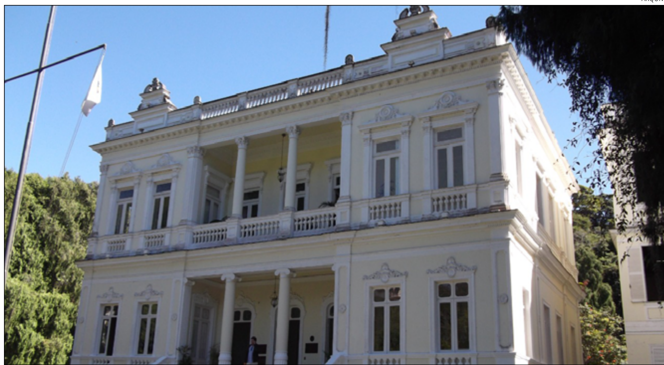
NOVO VALOR é resultado do aumento do índice de participação do município no rateio do ICMS Estadual para 2023