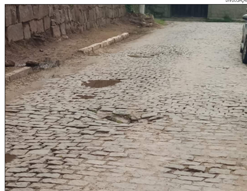
OS PROBLEMAS na Rua Irineu Corrêa começaram desde que caiu um muro

A Secretaria de Obras informou que uma equipe irá ao local e os consertos serão realizados em breve.