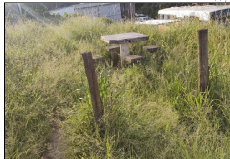
MATO tomou conta da área de lazer e pais reclamam abandono

A Comdep informou que a região está incluída no cronograma de ações e