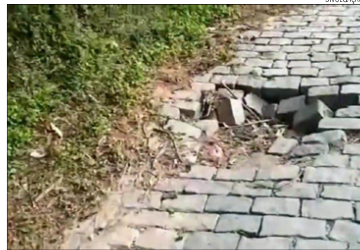
PARALELEPÍEDOS soltos e ponto de ônibus com mato alto

O Diário retorna ao tema na edição do dia 06 de junho para saber o que foi resolvido.