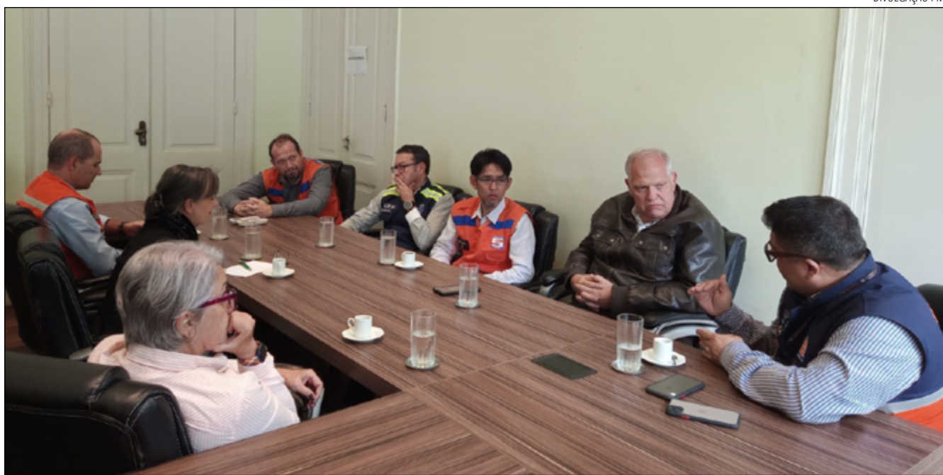
JICA conclui análise de áreas afetadas pelas chuvas e segue com cooperação técnica para projetos de prevenção

Um dos objetivos da JICA na cidade foi avaliar a possibilidade de implantação do projeto SABO, que prevê a construção de barreiras, já utilizadas no Japão, para a retenção de fluxo de