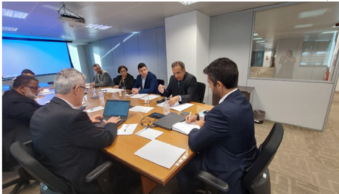
PRESIDENTE da Câmara Municipal e deputado voltam a pedir que a ANTT atue para impedir demolições na BR-040