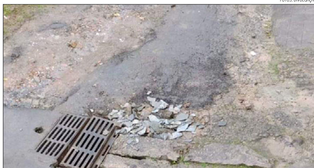
BURACOS, tampas de bueiros quebradas e outros problemas afetam os moradores no Quitandinha

Segundo informações de moradores, já houve pedidos de intervenção no local e a informação de que seria feito uma vistoria. “liguei para a Secretaria de Obras e falaram que iriam enviar alguém para fazer uma vistoria nas Ruas Araruama e Espírito Santo. Nem sequer