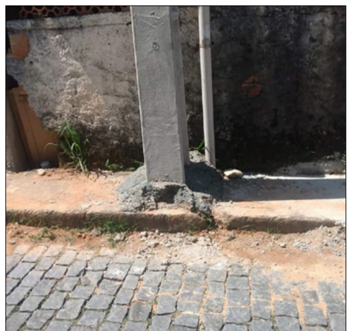
A ENEL Distribuição Rio vai remover o poste da calçada