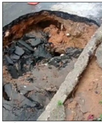
APÓS a chuva, buraco se abriu

Em outro lugar próximo, a via está comple-