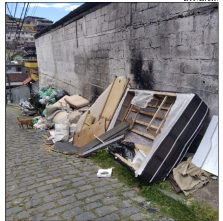
A CALÇADA fica tomada por lixo, entulhos e móveis velhos

Questionamos então a Prefeitura, assim como a Comdep, a respeito do motivo do recolhimento ainda não ter sido realizado, se há previsão de resolução para o problema e, no que se referem ao descarte irregular de móveis, quais atitudes têm de ser tomadas para evitar esta situação. Porém, até o fechamento da edição, não obtivemos resposta oficial de nenhuma das entidades.