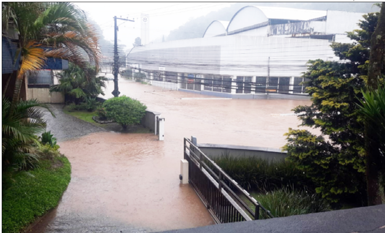
APÓS A tragédia de fevereiro, quando dois ônibus caíram no rio, novos protocolos de segurança foram definidos

“Conforme definido, os motoristas e a empresa mantiveram contato de forma preventiva, antes mesmo que houvesse a possibilidade de transbordamento dos rios. Desta forma, receberam todas as orientações necessárias, com base também nas informações divulgadas pela Defesa Civil, voltando a operar somente após a liberação das pistas, com total segurança”, explicou Tiago