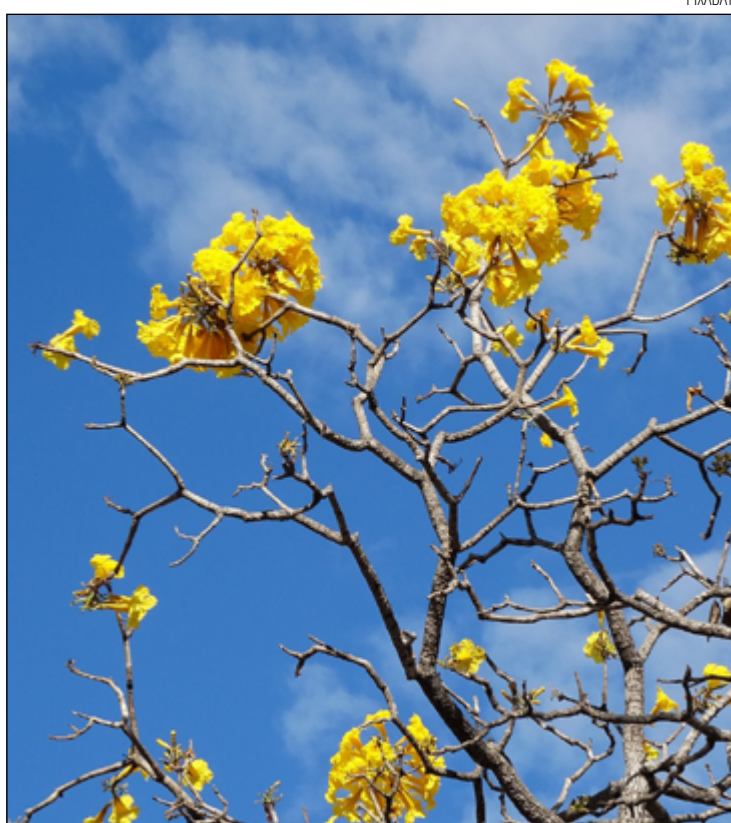
NOME DA moeda foi inspirado na árvore símbolo de Petrópolis