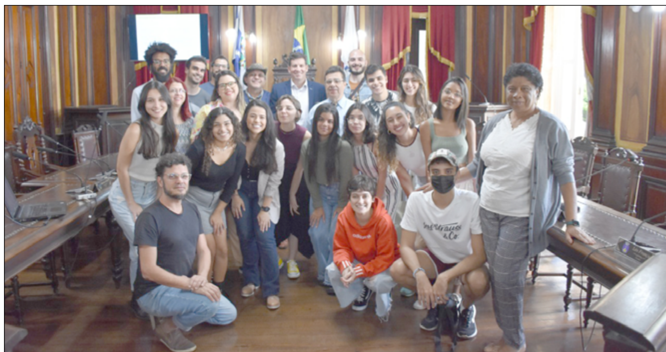
ALUNOS DE arquitetura da UERJ apresentaram desenhos e fotos com todas as influências arquitetônicas do Palácio

Alunos de arquitetura da UERJ apresentaram desenhos e fotos que exibiam todas as influências arquitetônicas do Palácio Amarelo, como os estilos rococó, neoclássico, barroco e eclético, trazendo em suas fachadas, por exemplo, arcos romanos, figuras de anjos, balaustradas, esfinges, molduras, portas francesas, dentre outros elementos externos.