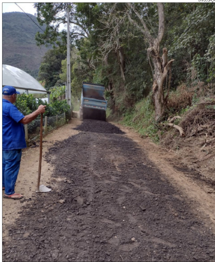
O TRABALHO vem sendo realizado desde o início do ano pela Secretaria de Obras