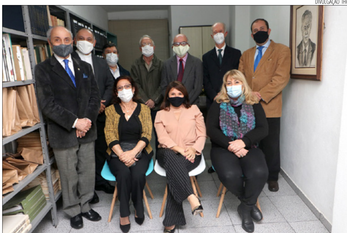
O INSTITUTO completou 83 anos de fundação no último dia 24 de setembro

a escoar a produção local. O trabalho, no entanto, também incluiu outras estradas da região, como a Taquaril”, esclarece Veiga.