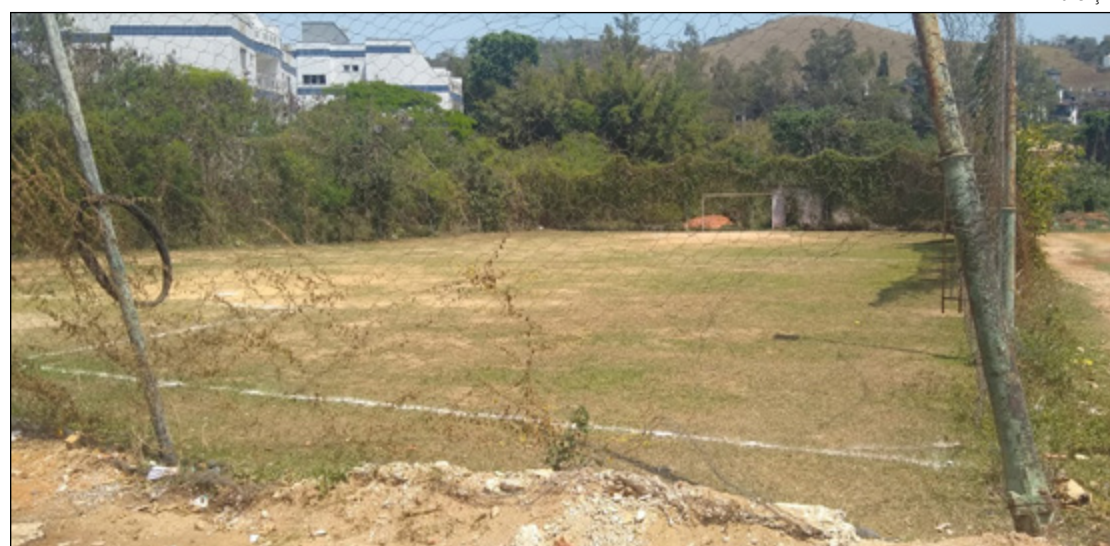
OBJETIVO DO idealizador do projeto é dar oportunidade de mudança de vida por meio do esporte

A ONG tem como objetivo a prática de futebol, com duas aulas semanais, às quartas e sextas-feiras, das 9h às 11h. A ideia é