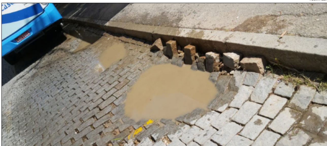
O AFUNDAMENTO da rua no ponto de ônibus causa poças d'água quando chove e incomoda passageiros

O Diário retorna ao tema na edição do dia 29 de dezembro.