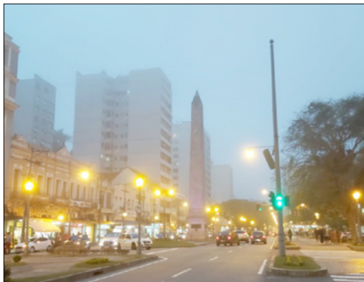
CHEGADA de mais uma frente fria promete chuva para Petrópolis

matempo – site especializado em previsões meteorológicas, as temperaturas vão variar entre 16°C e 27°C nesta quinta. Na sexta, os termômetros registram mínima de 16°C e máxima de 23°C. Neste dia o sol ainda aparece entre nuvens, no entanto, pode