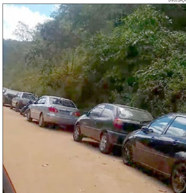
DESRESPEITANDO as regras, cachoeiras da cidade ficaram lotadas

Um vídeo compartilhado nas redes sociais, mostra uma extensa fila de carros e motos usados por banhistas para chegarem até uma estrada de Secretário, que dá acesso à cachoeira do bairro. "Depois reclamam que não tem vagas nos hospitais, mas as pessoas não estão nem aí para as medidas de segurança. Só sabem cobrar e não fazem sua parte", es-