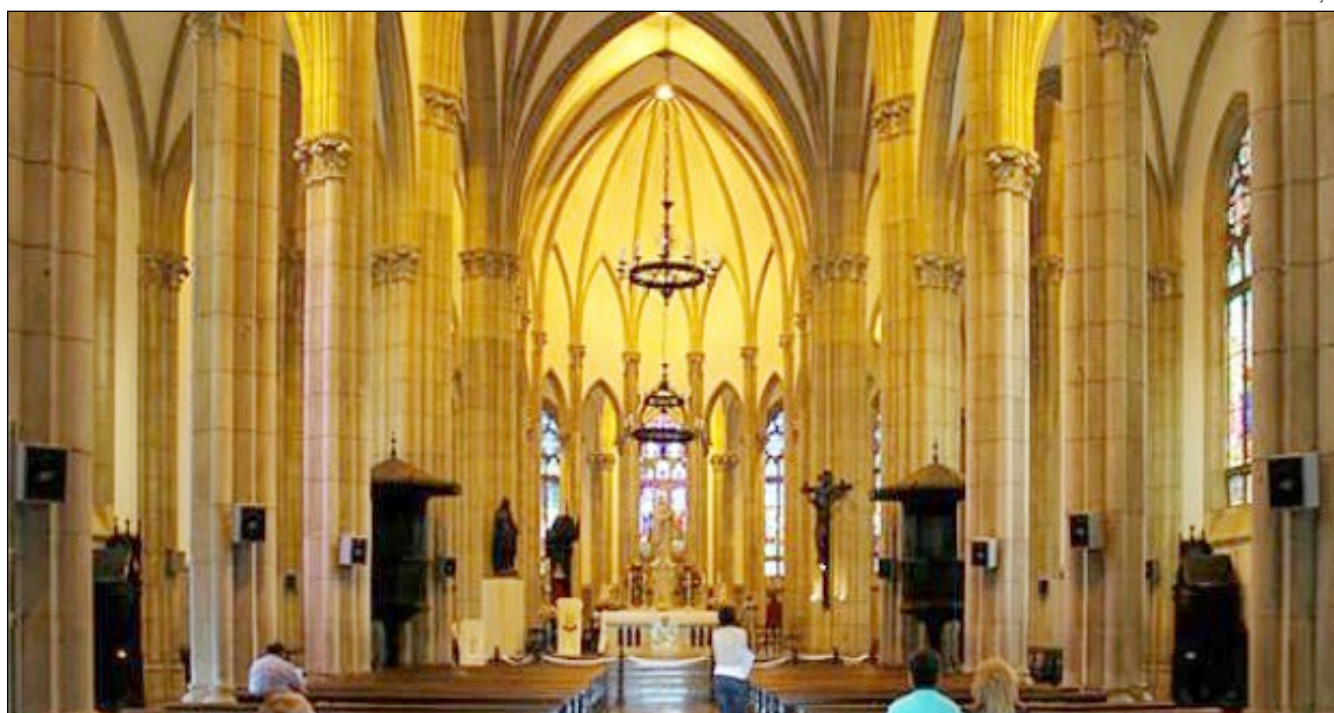
IGREJAS CATÓLICAS de Petrópolis seguem as recomendações do Vaticano e suspendem celebrações da Semana Santa

Na Igreja Metodista Wesleyana Central em Petrópolis, a celebração de Páscoa também será diferente. Os cultos presenciais estão suspensos desde on-