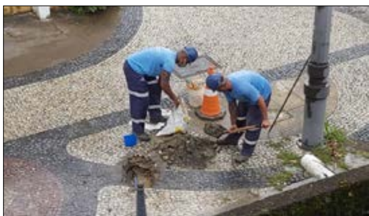
ÁGUAS DO Imperador providenciou o reparo em vazamento

Ainda ontem (09), conforme o prazo, uma equipe da empresa foi vista no local realizando os reparos necessários. O vazamento já era registrado há alguns dias no local, segundo relatos.