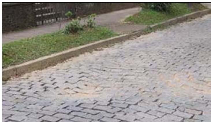
AFUNDAMENTO da rua no entorno da Praça do Bosque continua