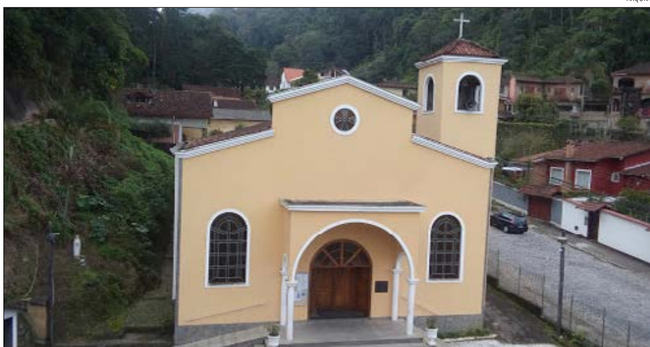
EVENTO EM homenagem ao frei Damião de Bozzano realizado neste fim de semana com missas e uma live na internet

Somos da ordem dos frades menores capuchinhos. Somos uma ordem com mais de dez mil frades distribuídos pelo mundo, em mais de 120 países. Nosso irmão frei Damião é italiano de