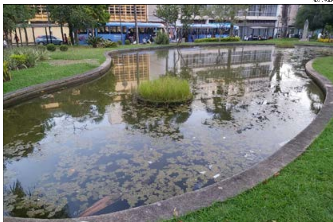
O LAGO continua sujo, uma árvore está com a estrutura comprometida e a rua ainda tem buracos

Conforme o calendário de acompanhamento dos bairros, o Diário retorna nesta edição aos problemas encontrados no local. Até agora, as notícias ainda não são boas, principalmente para quem utiliza o ponto de ônibus na localidade. Os desníveis continuam incomodando, já que, em dias de chuva, se transformam