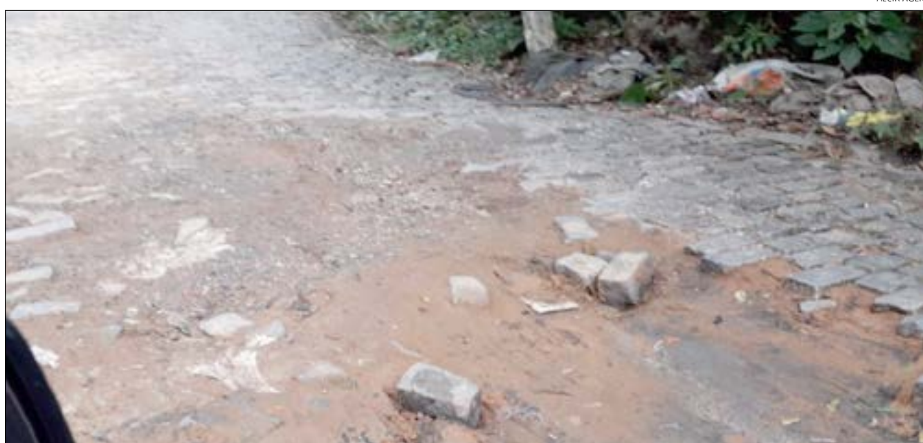
AS PÉSSIMAS condições da Serra Velha são reclamadas há décadas pelos motoristas que transitam por ela

Nos últimos anos, a articulação política entre a prefeitura e o DER rendeu um trabalho conjunto para melhorar as con-