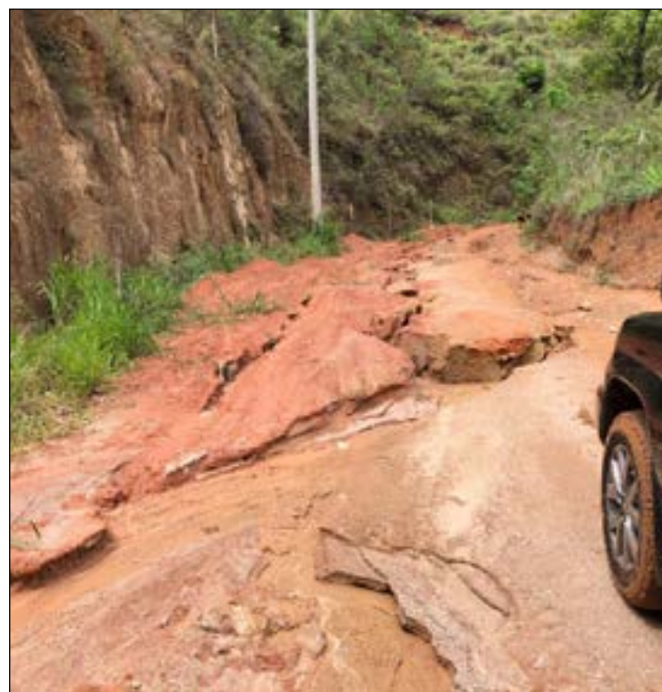
O TRÂNSITO de veículos está praticamente inviável na estrada

O reparo em caráter emergencial já tinha sido anunciado pela Prefeitura em estradas vicinais da cidade. Em um comunicado enviado a imprensa em janeiro, o município informou o início de manutenções em estradas vicinais do Brejal para melhorar o tráfego e disse que uma intervenção maior não poderia ser realizada, devido às chuvas. Prometeu que o trabalho completo seria