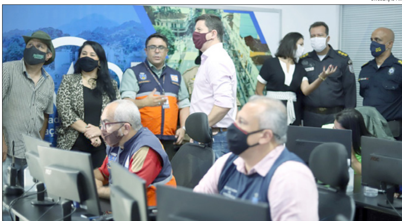
O PLANO Verão estabelece procedimentos a serem adotados pelos órgãos envolvidos em situação de emergência

“A Defesa Civil atua em várias ações para otimizar recursos e melhorar o atendimento da população para que seja mais célere e eficiente. O CIMOP é um centro de monitoramento de Petrópolis, que busca a gestão integrada de todos os órgãos durante as ocorrências - além da segurança pública. Um exemplo dessa integração é o trabalho que vem sendo feito com a Assistência Social, que atua em plantão para agilizar o atendimento da popu-