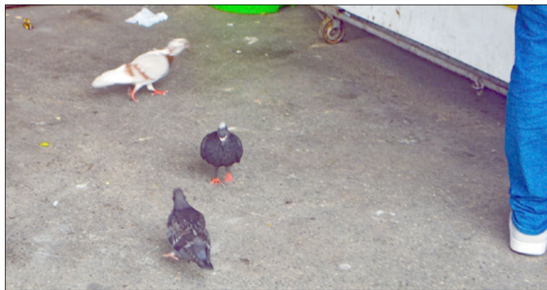
USUÁRIOS dos terminais reclamam da sujeira e se preocupam com doenças causadas pelos pombos

A Companhia Petropolitana de Trânsito e Transportes - CPTrans, que faz a gestão dos terminais rodoviários urbanos da cidade,