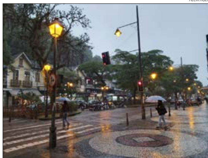
AINDA não será possível guardar os agasalhos, vem nova frente fria

De acordo com o portal meteorológico, o mês começa com as temperaturas em elevação, após os gelados dias do fim de julho. Mas entre os dias 5 e 6, a primeira frente fria de agosto se aproxima, praticamente sem provocar chuva, mas com queda sig-